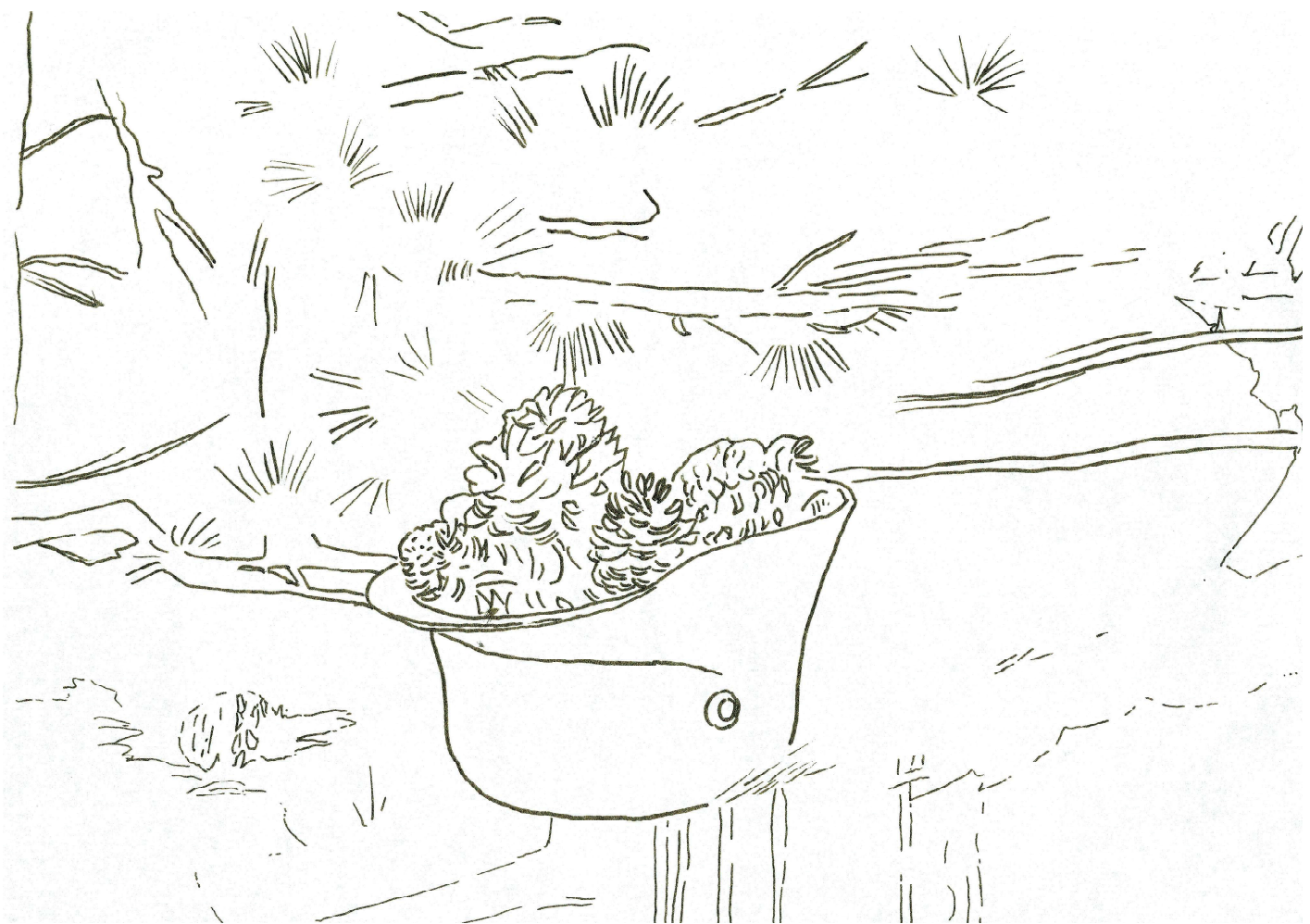
《鉄兜》(松ぼっくり男爵習作)