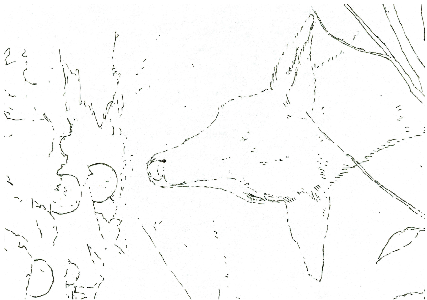
《ラストナイト》(シヤックライト習作)