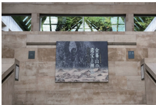
企画展「金峯山の遺宝と神仏」も常設展示も充実していました