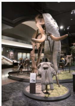
ミエゾウの頭骨と復元展示

「すべての人々に開かれた、学びと楽しみと、そして未来を考えるための機関」（文化庁ホームページより）である博物館。広くてゆったりしており、琵琶湖にまつわる地形・地質・生態系から人々の営みまでを総合的に魅せてくれる展示を大いに楽しみました。