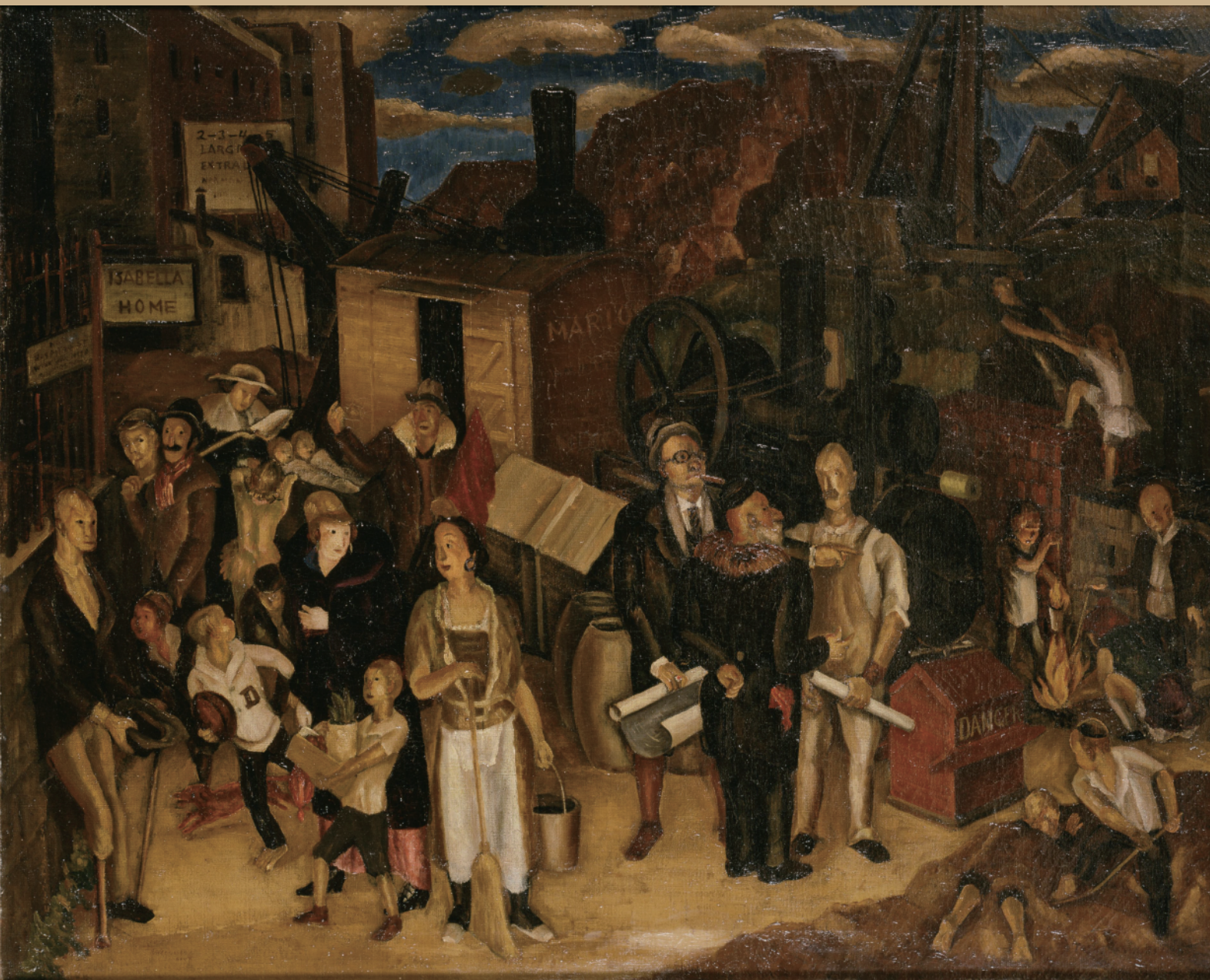
清水登之《建築現場（ワーガーデン）》