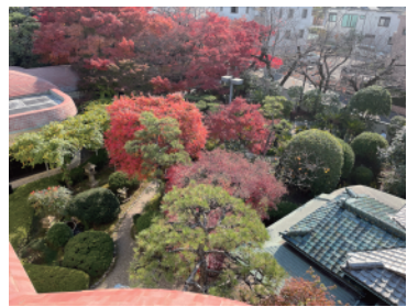
桑山美術館の屋上からお庭を眺める