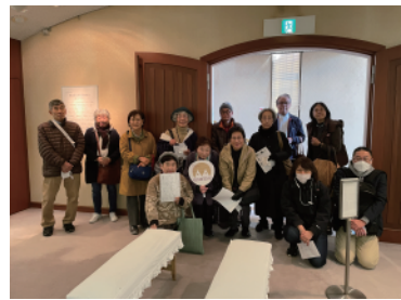
桑山美術館にて 「茶道具にみる不易流行ー桃山から令和ー」展 の解説を聞く会員

午後からは古民家にお邪魔しました。1937(昭和12)年築の川原田家は、和風の建物の中に西洋の要素がミックスされた国登録有形文化財です。はじめに登録の経緯やご苦労、しつらえのレクチャー、その後自由散策。ご夫妻のお話はとても楽しく、居心地よい空間を堪能させていただきました。