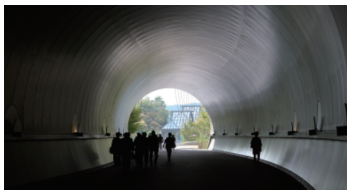
ここを抜けると12年ぶりのMIHOミュージアム