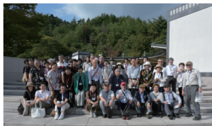
まずは集合写真。お天気も良く美術館に移動するのもお散歩気分でした。

12年ぶりのMIHOミュージアム。前回は東日本大震災直後であり、複雑な思いを抱えて参加された方もいらしたのではないのでしょうか。異空間へと誘うようなトンネルは変わらず、会員を迎えてくれました。