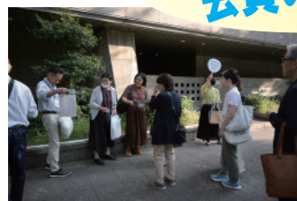
出発前の受付。この光景も久々です

友の会名物、手づくり「懇親日帰りバスツアー」。美術好きみなで、一人で行くより楽しい、自分じゃ行かないところを探して企画しています。今年度の企画展で博物館のおもしろみを知り「ちょっと行ってみよう！」「滋賀ならMIHOミュージアムも行こう！」と久々の開催に踏み切りました。