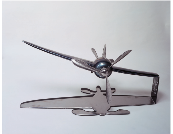
篠原猛史 《真っ直ぐな曲線》2004年 鉄・ステンレス 49.3×151.3×76.5 cm

不思議なタイトルに思われるかもしれない。「真っ直ぐ」と「曲線」は通常感覚であれば相容れない。それは数学を学ぶときに必ず登場してくる、あの虚数の存在、マイナス1の平方根と同じようなものかもしれない。単に物質としては成立しないだけで、X軸とY軸で表される座標軸を用いての、交点となるゼロ地点、そしてマイナスといった考え方は、数式を使って表現される物理学の世界においては普通のもの。同様のことがアート制作においても援用される。今回紹介する篠原の作品には、「場と量の変換性」というサブタイトルがついており、さらには「風の力」というサブタイトルもある。作品としては、飛行機型の三次元の本体に光があたっていると想定して、床面に伸びていく影が二次元的に造形化されていて、そのまま彫刻でいうところの台座となっている。その影も、鏡面の部分と鏡面ではない部分で二重となっている（鏡面は言うまでもなく実体を反転させてイメージとして映し返す。そこに映っているイメージを仮に「虚体」と呼ぶことも可能だろう）。さらには飛行機型の先端と尾にはプロペラがついており、手前から風が流れると、双方のプロペラは互いに逆向きに回転するようになっている。風が引き起こす回転は飛行機本体を揺らし、それが振動となって、音となる。美術館の展