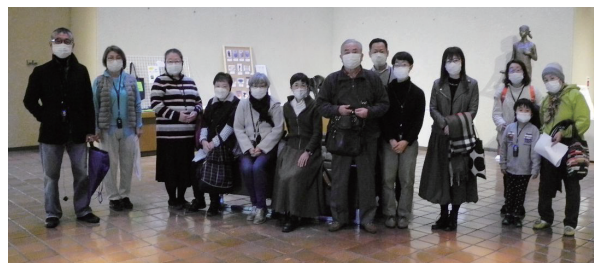
参加された会員のみなさん