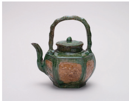
《三彩畷文水注》 中国 清時代（18世紀～19世紀）

煎茶は、江戸時代中期、売茶翁（ばいさおう）・高遊外（こうゆうがい）によって広まりました。文人の嗜みとされ「文人（煎）茶」とも呼ばれるようになります。煎茶が中国から伝えられたこともあって、初期の煎茶具は中国製が中心でした。日本の文人に好まれたのも唐物と呼ばれる中国宋代以降の器物で、日本でも多くの写しが作られました。また、中国古代の器物や茶の湯の器を、煎茶具に見立てて転用することも行われました。特集展示では、この見立ても交えながら、煎茶に関わる道具を展示する予定です。