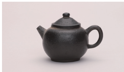
《紫砂茶壺(烏泥茶鉢)》 中国 清時代（18世紀～19世紀）