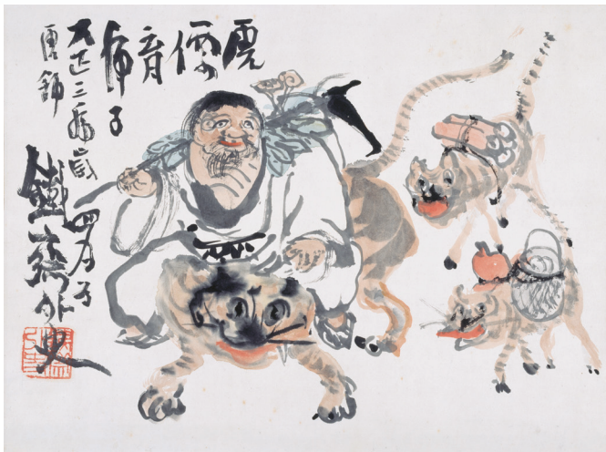
富岡鉄斎《虎養育子図》大正3（1914）年 紙本着色

多く、当館で久しぶりにご覧になれる機会となるでしょう。書画一体で鑑賞される俳画・詩画では与謝蕪村、呉春（ごしゅん）などがあります。ほか、白隠慧鶴（はくいんえかく）、仙厓義梵（せんがいぎぼん）、伊藤若冲、長沢芦雪たちの水墨画を展示予定。幕末から大正時代にかけての儒学者で文人画家・富岡鉄斎の作品も外せません。