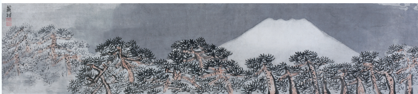
与謝蕪村《富嶽列松図》江戸時代中期（18世紀後半）紙本墨画淡彩 重要文化財

南画は中国の文人画の理念と南宗画の様式を中心としつつも、様々な明清の絵画様式の影響を採り入れて、江戸時代中期（18世紀）に成立しました。南画を大成した与謝蕪村や、個性を発揮した浦上玉堂などの作品は、館外の展覧会への出張が