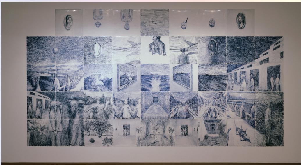
《透明壁画、人工夢》2005年 テンペラ・シリコンラバー、ポリエステルフィルム 480.0×920.0cm

2020年の11~12月、愛知県美術館友の会会員限定視聴の動画として、翌年3月に愛知県立芸術大学教授の退任を控えた設楽知昭さん（以下敬称略）が10月から行っていた退任記念展会場での作家トークが配信されました（会報第50号参照）。