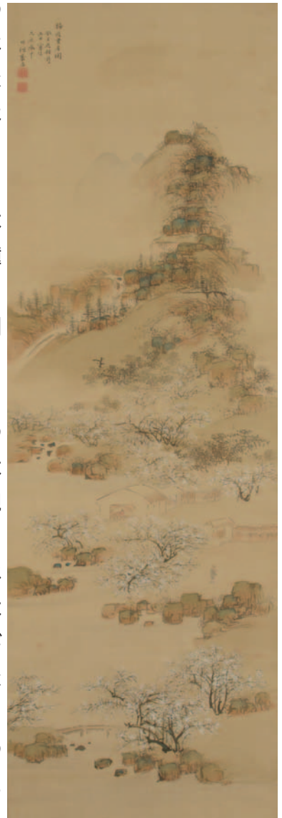
中林竹洞《梅花書屋図》天保4年(1833年) 愛知県美術館(木村定三コレクション)

文人画家、中林竹洞の山水画をはじめ、山水図様が描かれた陶磁器などを紹介します。中国の画とは趣の異なった日本人による山水の風景をご鑑賞ください。