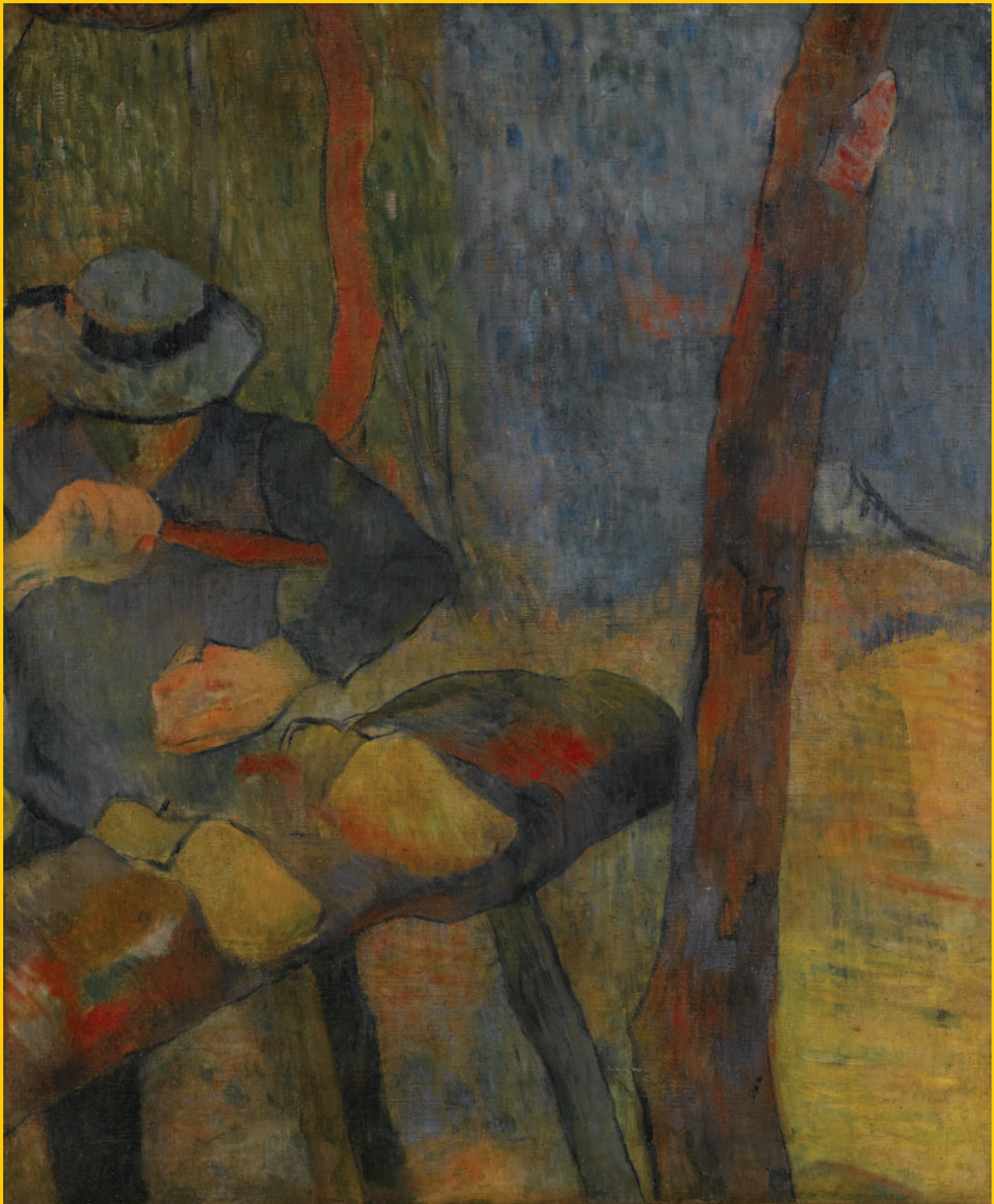
ポール・ゴーギャン《木靴職人》1888年

この展覧会で日本人の感性を喚起[美しき日本の自然展] / 会員のひろば / 愛知の芸術家たち / 愛知県美術館コレクションから [ポール・ゴーギャン《木靴職人》《海岸の岩》] / 友の会活動紹介