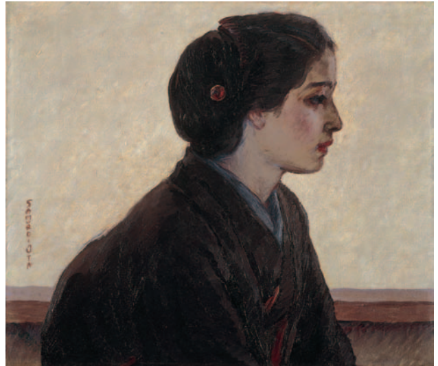
太田三郎《婦人像》1915年頃

島町(現・清須市)の出身である。黒田清輝に師事した文展系の洋画家であり、主に中央で活躍された。川端康成の『浅草紅団』の挿絵も担当されていた。その後「地方文化の自主性と自立のために役立ちたい」と地元に戻られ、美術に理解の深かった当時の桑原幹根知事のもとで、館長として尽力されることになったのである。