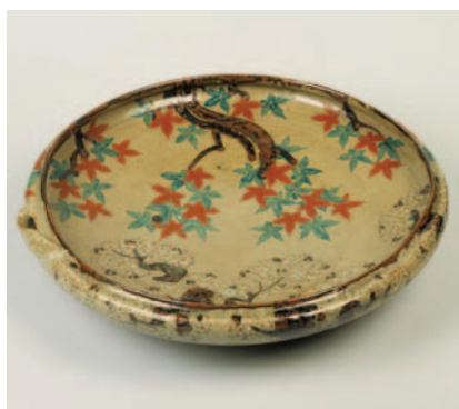
《色絵雲錦手片口鉢鉢》犬山 江戸時代後期(19世紀) 愛知県陶磁資料館

ここでは、時代の枠にとらわれず、自然に共感や親しみをもって制作された作品を展示します。この章では、近代以降の作家、たとえば萬鉄五郎、東山魁夷らのように西洋思想に触れながらも、日本人独特の感性で制作をしていた画家も取り上げます。様々な時代の作品に接することで、日本人がもっていた自然への感覚を感じとりやすくなるのではないのでしょうか。