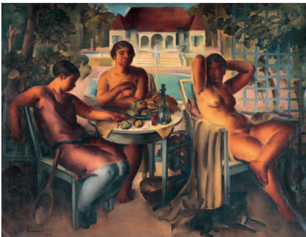
太田三郎《三嬌図》1929年