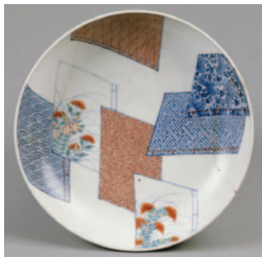
《色絵草紙文皿》有田・鍋島藩窯様式 江戸時代(17~18世紀)愛知県陶磁資料館

万葉集では、萩やすすきなどの秋の草によって呼び起こされた心情が、「秋草」の歌として多く詠まれています。西洋の、自然をそのままにとらえる写実とは異なり、日本人は自然によって引き出された感情を表現します。これは、