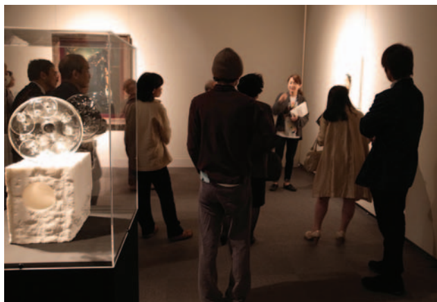
不思議な展示に魅了される

会場入口には「魔女」への変身コーナーが設けられ、そのコスチュームを目にすると更に鑑賞への期待が高まります。いざ会場内に入るとマジックに使われる「箱」から飛び出したように様々な作品が並び、ジャンルも絵画・版画・