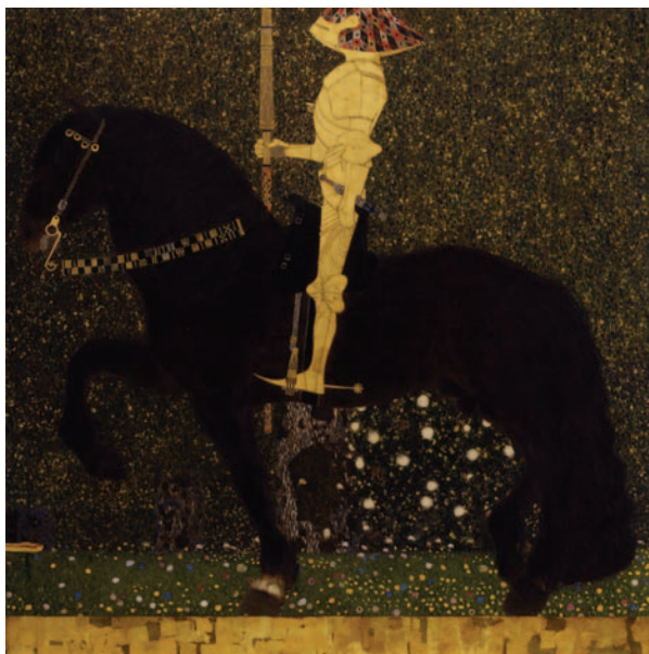
グスタフ・クリムト《人生は戦いなり(黄金の騎士)》1903年

愛知県美術館が開館10周年を迎えようとしたとき、クリムト展を企画する話が出ましたが、極めて難しいという判断から実現には至りませんでした。20周年に向けて再度企画されたのが今回の展覧会です。ところが、あいにく2012年はクリムト生誕150周年にあたり、当館の作品を含め世界中のクリムトの作品が生地ウィーンに集まりました。もともと個展をすること自体が難しいうえに、そのような年に日本でクリムト展をすることは現実的に不可能です。そこで、1903年に描かれた当館の《人生は戦いなり(黄金の騎士)》を核に展覧会を構成することにしました。クリムトが深く関わったウィーン分離派(1898年創設)やウィーン工房(1903年創設)に関連する作品を取り入れつつ、クリムトの作品展開もある程度たどれるような構成になります。いつもは単独で展示されている孤高の騎士が、異なったコンテクストの中で展示されるとどのように見えるか、今から楽しみです。(企画業務課長 古田浩俊)