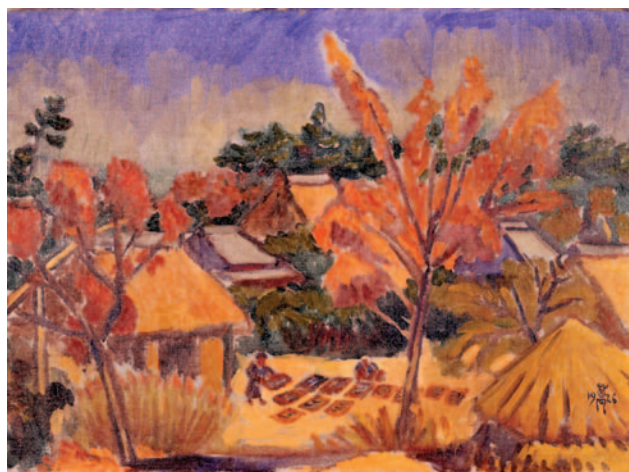
萬鉄五郎《紅葉風景》1926年 愛知県美術館

本展では、美術や工芸の分野で自然がどのように表現され、図様化されてきたかを紹介することで、日本人の中に本来あるはずの「自然と