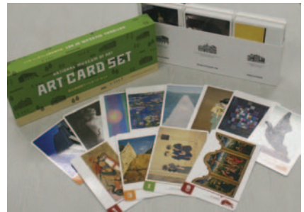
来春から市販される 独立行政法人国立美術館制作のアートカード

ドは作品の前でも使うことができます。展示室の中にお気に入りの作品のカードを持ち込んで、展示作品と自由に見比べてみたり、また逆に、よく知らなかった作品のカードを手にしながらかし室の作品を鑑賞すると、理解を深めることができるかもしれません。（学芸員 塩津青夏）