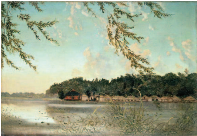
高橋由一《不忍池》1880年頃

リニューアルオープンする美術館のための蒐集は、開館以前の1988年から始められていました。今回行われる『美の精髓 愛知県美術館の名品300』展は、それ以降これまでに蒐集してきた作品を中心に展示される、いわば愛知県美術館のコレクションの集大成と言えます。