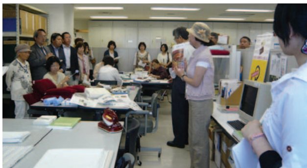
友の会の活動などを説明する

6月11日に九州国立博物館の活動を支援する諸団体の方々が27名来館。交流会では会の活動や運営等について意見交換し、ボランティア活動を見学されました。県美友の会の組織や講座等の運営、美術館から自立していることや、ボランティア活動が充実して進められていることにとても感心されていました。