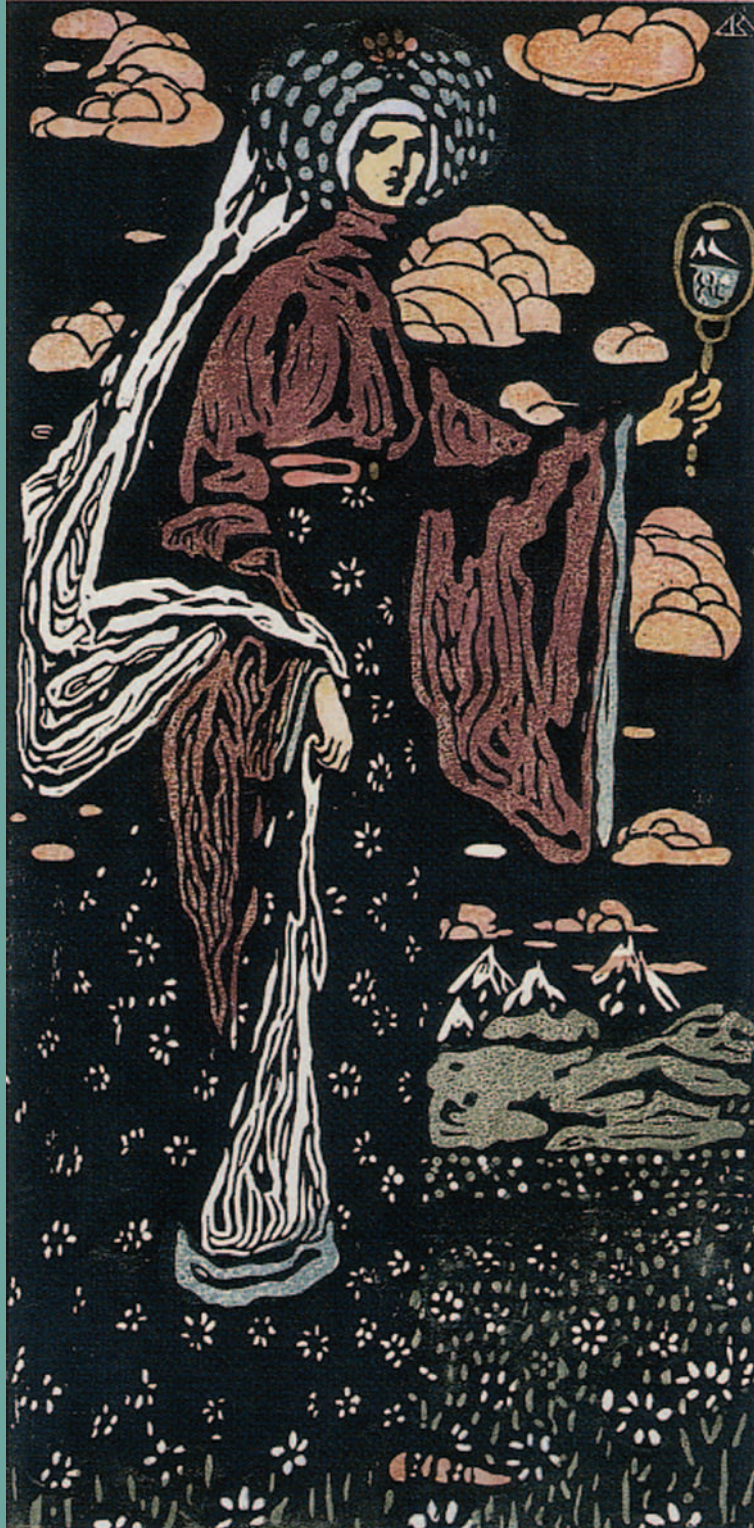
ヴァシリー・カンディンスキー 《鏡》1907年

この展覧会は県美のエッセンス満載[美の精髓] / 会員のひろば / 講座ダイジェスト[渡辺華山の絵画と生涯][現代の表現] / 愛知県美術館コレクションから[カンディンスキー《鏡》] / 愛知県美術館より / 友の会活動紹介