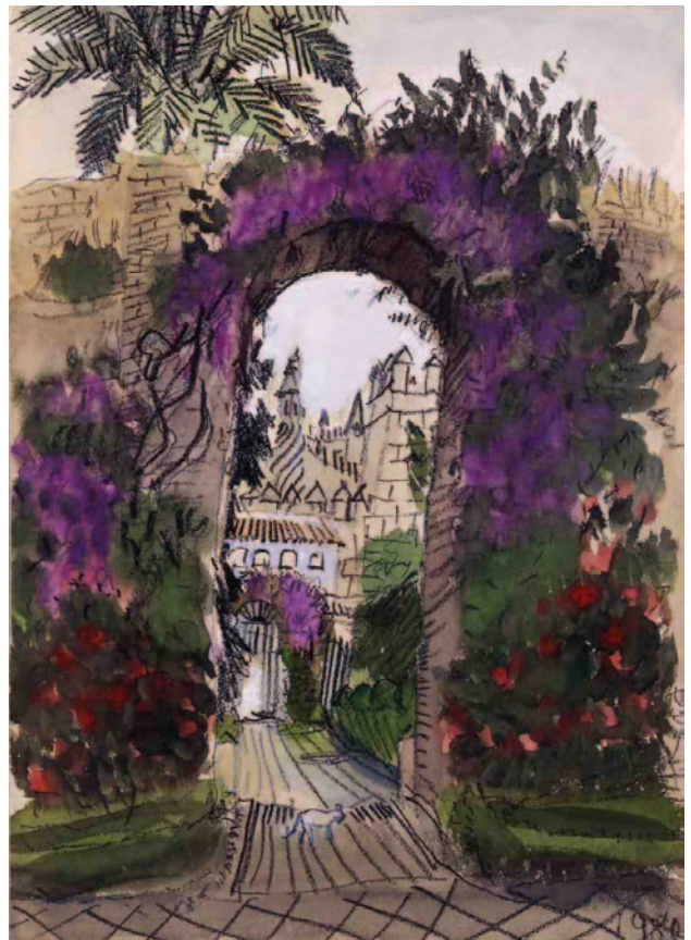
《セベリア》1980年 コンテ・水彩、紙

最晩年には、オブジェや幡 ぼん の制作に熱中しました。また、92歳を過ぎてからは自画像を多く描くようになりました。昆虫や植物で作った《自然からの勲章》という自作の勲章を身に付けた自画像からはユーモアあふれる人柄がにじみ出ています。彼の自画像の前に立つと、思わず話しかけたくなくなってしまいます。彼が亡くなった後も、作品は生きているのです。是非、ご自身の目で確かめてみて下さい。