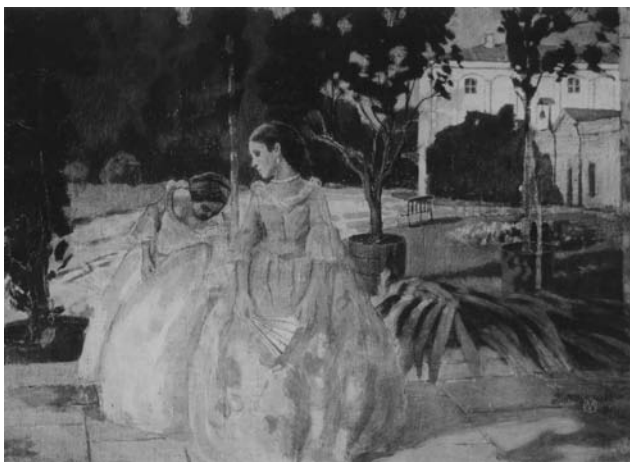
参考図版 ポリーソフ＝ムサートフ《ゴブラン織》1901年

抽象絵画の創始者の一人として知られるカンディンスキー（1866-1944）が、絵画を学ぶために祖国ロシアを離れてミュンヘンに出たのは1896年、29歳の時でした。カンディンスキーは生涯に200点ほどの版画を制作しています。200点といっても、それだけの絵柄があるということで、実際に刷られた版画の数はその何倍にもなります。例えば表紙の《夕暮れ》は4つのステートがあり、愛知県美術館の作品は第4ステートなのですが、同じ第4ステートとされている作品は、パリ国立近代美術館に1点、ガブリエーレ・ミュンター財団に2点あります。カンディンスキーの版画は1902年に始まり、画家の40数年の画歴における初期の10年少々の期間に集中して制作されています。版画の種類からいうと、1913-14年にエッチングを制作する以前はほとんどが木版画で、それ以降はドライポイントやリトグラフが増えていきます。1903年制作の《夕暮れ》は、カンディンスキーの最初期の版画に位置づけられます。