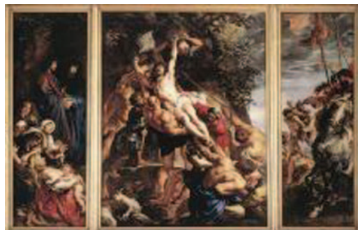
② 同《キリスト昇架》1610-11年