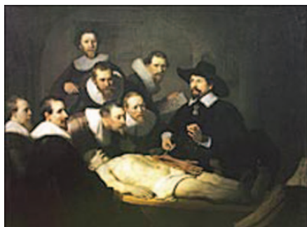
④ レンブラント・ファン・レイン 《テュルプ博士の解剖学実習》1632年

彼自身は自分の使命は歴史画家であるとしていた。それはバロック時代の絵画の序列において最も格が高いとされたのが歴史画家であったためである。その一方でレンブラント没後に自分たちの先駆者として時代ごとに異なる多種多様なイメージで語られたことは、レンブラントの芸術の多面性と普遍性を物語っているといえるだろう。（平松）