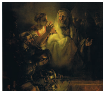
⑥ 同《ペテロの否認》1660年