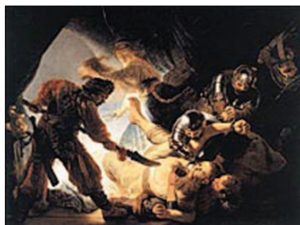
⑤ 同《眼を潰されるサムソン》1636年