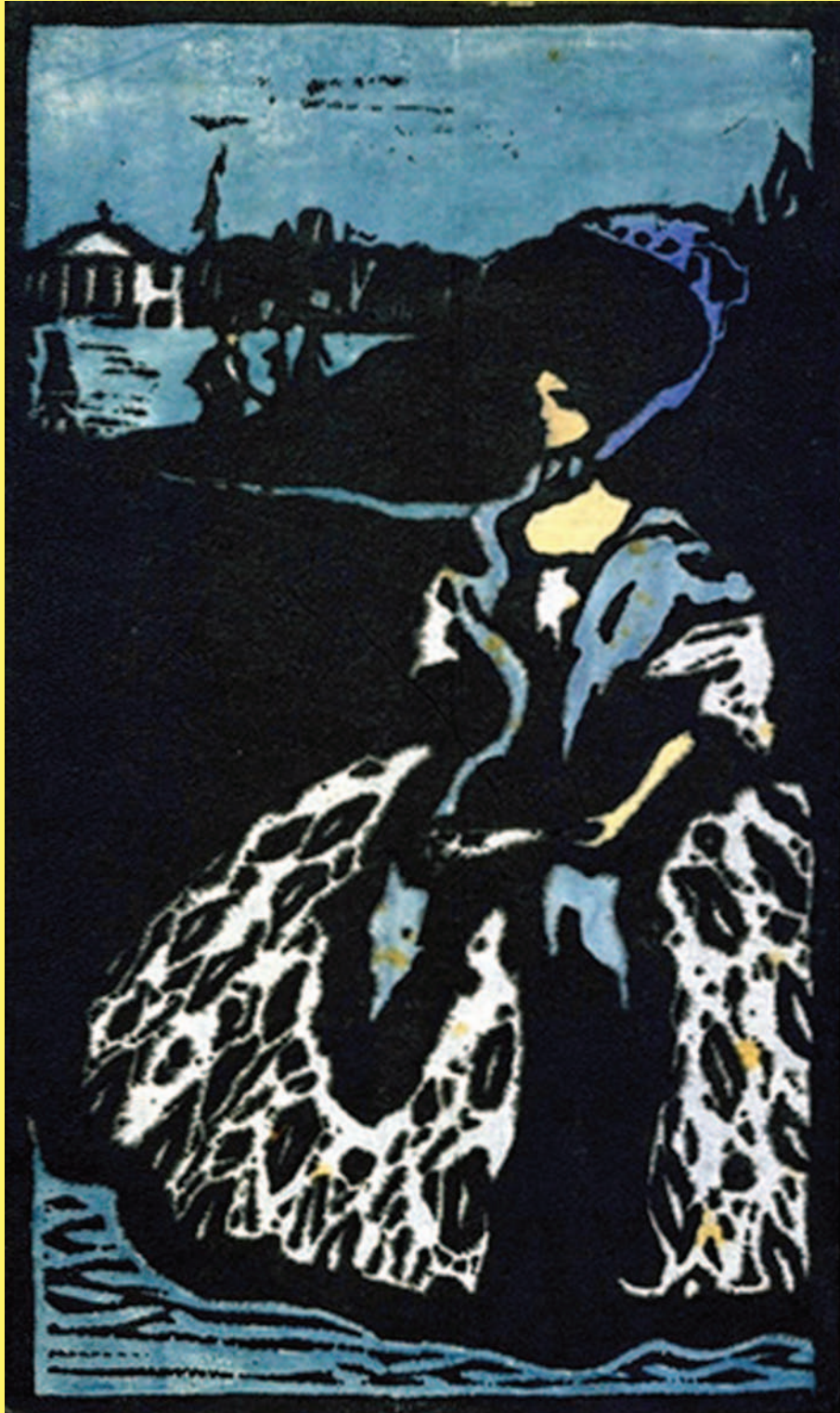
ヴァシリー・カンディンスキー 《夕暮れ》1903年

この企画展は感激を分かちあえる[杉本健吉展] / 会員のひろば / 愛知県美術館コレクションから[版画家としてのカンディンスキー] / 講座ダイジェスト[西洋美術バロック美術の光と影] / 友の会活動紹介