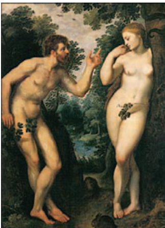
①ピーテル・パウル・ルーベンス 《アダムとエヴァ》1600年以前

彼の芸術を考える時、次の要点があげられる。フランドルの写実の伝統を踏襲しつつ、古代美術