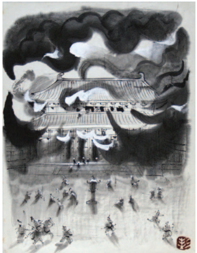
「灼身大佛・嘲人間愚」(『小説週刊朝日 新・平家物語』のための下絵)

挿絵には夜の場面を描いたものがたくさんあります。墨の巧みな使い方によって、月夜の深深とした空気や、梅の咲く春の宵を、まるで色彩が