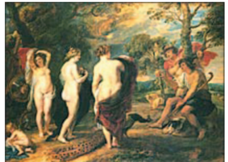
③ 同《パリスの審判》1632-35年