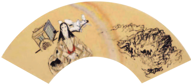
「夢占い」（『画帖 新平家物語扇面』より）

新たな描法を発見していくことにもなったのです。円窓や扇面の中に描かれた場面や、登場人物の名前や和歌などの文字が書き添えられたものなど、日本的な装飾性が挿絵の味わいを深くしています。今回の展覧会では、同じ場面を描いた挿絵がどのように描き変えられていったのかということも比較して見られるように展示されています。