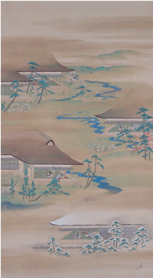
渡辺清《源氏物語図》1858年