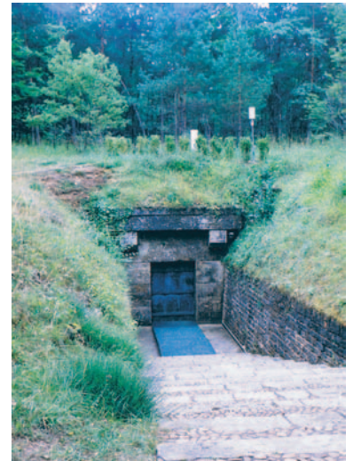
ラスコー洞窟入口

旧石器時代の人たちは、なぜあのような光の差さぬ場所に描いたのであろうか。それも動物ばかりを、しかも横向きに。ようやく今にして、それは、外の光の差し込まぬ場所にこそ描かれるもの、そうした場所でこそ見ることのできたものと了解される。現代人である私の力なき視覚の、それでもかすかにつながる遠い人類