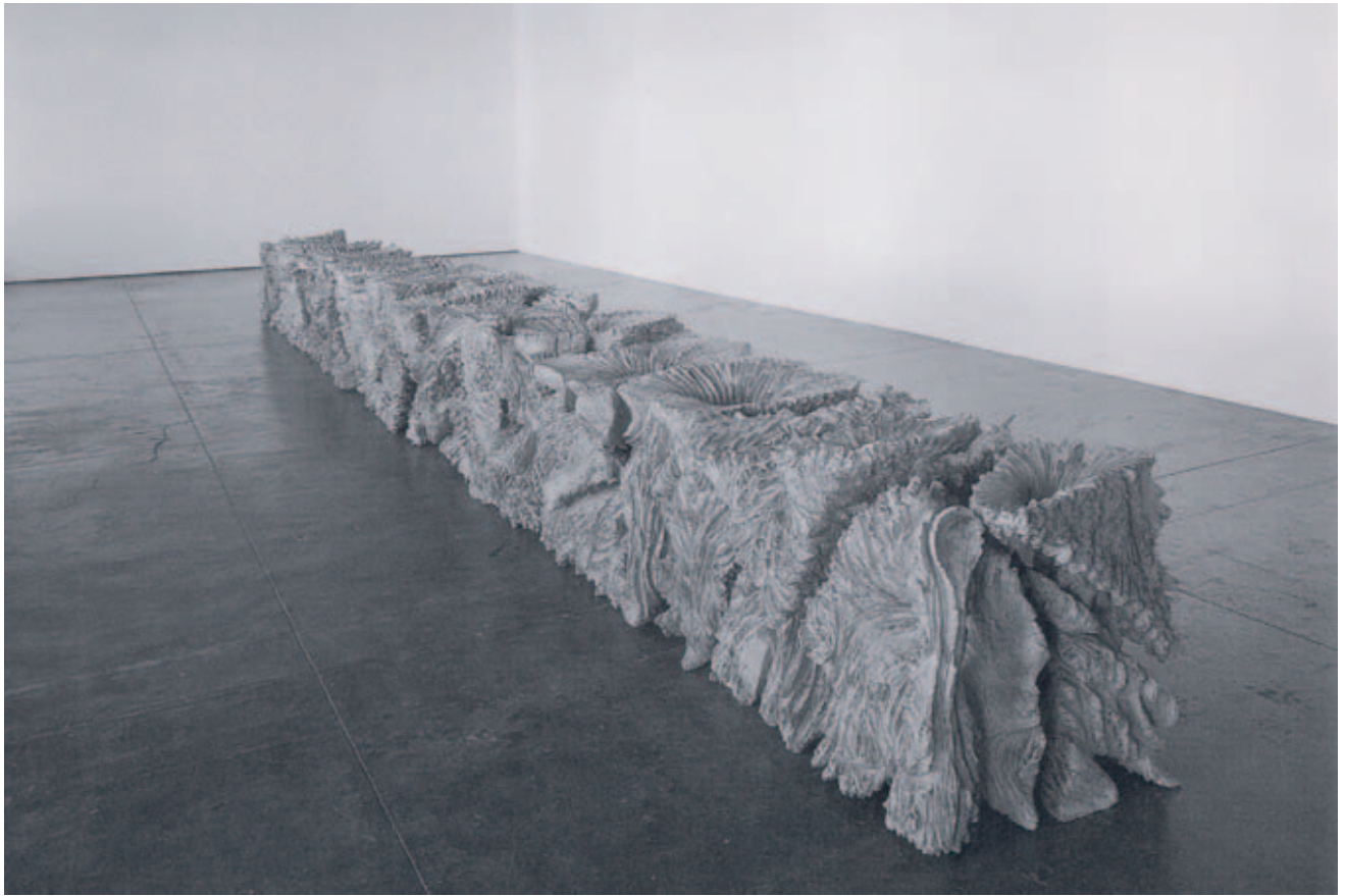
戸谷成雄《双影体Ⅱ》2001年 2004年度購入

代の我々には到底理解できないような動機もあります。今と異なる経緯で愛知県美術館に収まった作品を、現在の我々はどのように感じるのでしょうか。