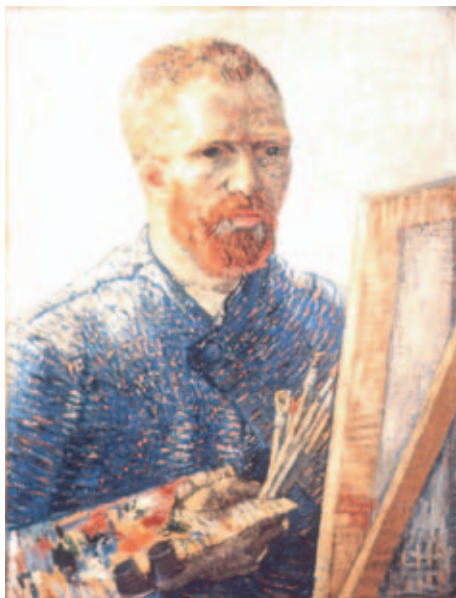
フィンセント・ファン・ゴッホ 《芸術家としての自画像》1888年

さて、今回の展覧会は、ファン・ゴッホの二大コレクションを有する、ファン・ゴッホ美術館、