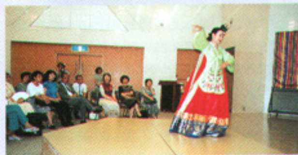
企画展に合わせ韓国舞踊を鑑賞

表紙の作品は磯見輝夫（1941-）《鳥の如く》（1988年木版 和紙 80.0×119.0cm）。平成14年度友の会より愛知県美術館へ寄贈した2点の作品のひとつ。