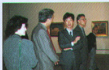
特別監査会で学芸員と