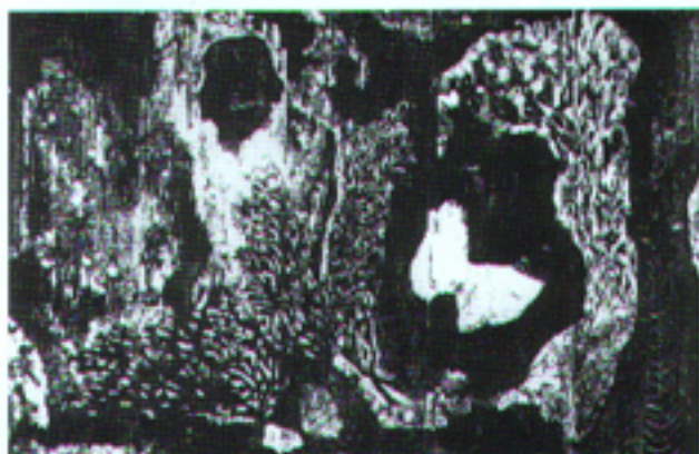
《春の誕生》1988年 木版 和紙 76.0×116.5cm